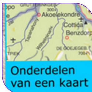
Onderdelen van een kaart