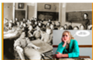
Doe historisch onderzoek

Ter voorbereiding op het onderzoek hebben we diverse kaarten in de Jeelo omgeving behandeld en besproken wat voor bronnen je kunt gebruiken bij een historisch onderzoek.