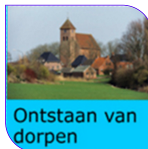
Ontstaan van dorpen