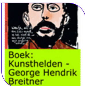
Boek: Kunsthelden - George Hendrik Breitner