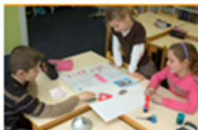
Maak een muurkrant