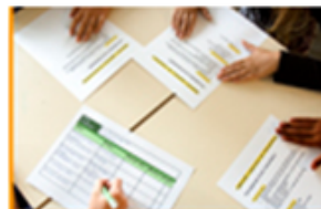
Maak een taakverdeling en planning

In de klas startten we het project met een bezoek aan de oude school, waar nu het bedrijf van Wytse Prins is. In het gebouw zijn nog de prachtige houten plafonds; de mooie vloer in de gang met de wc's; het raampje naar het oude schoolplein en de deur naar het kolenhok te zien.