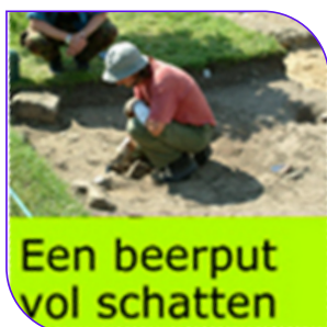
Een beerput vol schatten

In de klas worden 'schilderijen' gemaakt met, net als Breitner een foto (meestal uit Warns) als 'studiemateriaal'.