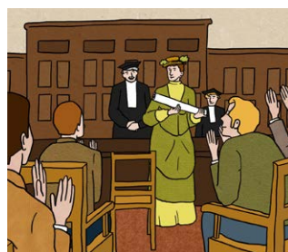
Leer over Aletta Jacobs

"Mijn opa is mijn held. Hij maakt me altijd blij en door hem kan ik goed kanoën. Vroeger had je ook helden. Aletta Jacobs is nog steeds een held. Door haar mag ik nu ook naar school. Michiel de Ruijter was een andere held. Dat varen vind ik wel stoer, maar ik vind hem geen echte held. We hebben van een meneer van het archief een rondleiding gehad langs beelden in ons dorp. Hij wist alles. Op het einde speelde ik een standbeeld van mijn eigen held."