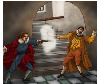
Leer over Willem van Oranje

Daarover ging mijn betoog. Dat mochten we schrijven op een middelbare school samen met 5-vwo-leerlingen met het eindexamenvak geschiedenis."