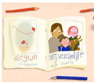
Maak een fotoboek