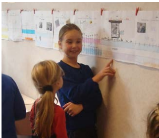
Maak een tijdbalk

"Eerst ging het project over de Gouden Eeuw en de VOC en hoe Nederland rijk werd. Maar zoals de handel toen ging, was niet eerlijk. Een exporteur in peren vertelde over hoe dat nu beter gaat. Ik maakte er een rap over. Met de klas maakten we ook een foodverhaal voor 2040. Het ging over een voedselmachine met lekker en gezond voedsel en genoeg voor iedereen."