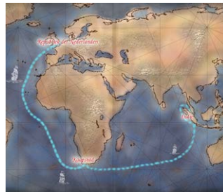
Wereldhandel en de VOC