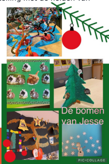
De bomen van Jesse

Tijdens de afsluiting zullen we de kinderen hun eigen boom van Jesse presenteren, een aantal tijdens de dienst en de andere tijdens de lunch. Ook kunt u de tentoonstelling met de helden van de kinderen in de hal bewonderen.