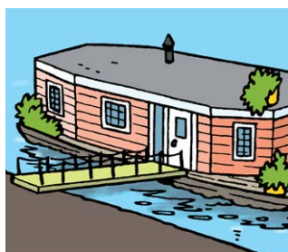
Soorten huizen herkennen

"Iedereen heeft zijn slaapkamer in het klein in een schoendoos gemaakt. Daar hebben we toen een flat van gebouwd. Het dak is voor iedereen. Daarom hebben we er een speeltuin op gemaakt. De flat staat nu nog in de bouwhoek. We spelen er soms nog mee."