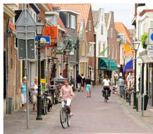
Verstedelijking van Nederland

"We hebben met de hele klas een wijk ontworpen. Elk groepje kreeg een stuk grond om in te richten. Toen we alle stukken grond aan elkaar legden, hadden we te veel zwembaden en te weinig huizen om in te wonen. Toen moesten we samen overleggen om er toch een goede wijk van de maken. Een mevrouw van de ruimtelijke ordening van de gemeente heeft ons plan beoordeeld."