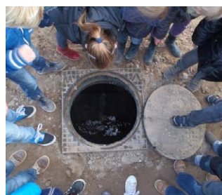
Buizen door de wijk

"Het project begon met een rondleiding door de wijk. Een man van de gemeente vertelde over het riool en de verlichting in de straat. We hebben ook papier geprikt in de straat. Ik wist niet dat voor de straat zorgen zoveel werk was."