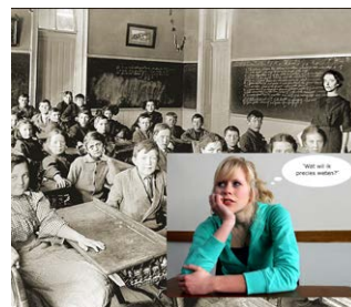
Doe historisch onderzoek