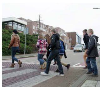
Ontdek je straat