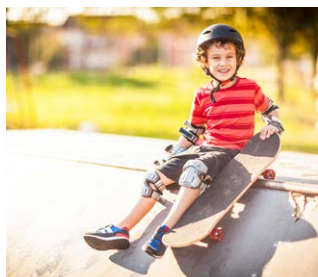
Waar is wat te doen in je wijk?

"We zijn eerst in het buurthuis geweest. We moesten daarna zelf een rondleiding maken door de wijk voor een nieuw klasgenootje. Ik gebruikte daarbij Google Earth. Dat was voor mijzelf ook heel leuk. Ik heb ontdekt dat er veel meer te doen is in onze buurt dan ik dacht."