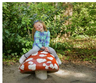
Toerisme in Nederland